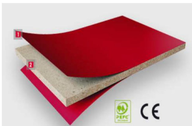
Panneau bois Mélaminé

La Cloison acoustique sur bureau Damier 3D est composée d'un panneau Mélaminé de 19mm d'épaisseur et des panneaux Absorbruits® de 20 et 40 mm d'épaisseurs en mousse souple alvéolée avec une qualité exceptionnelle d'absorption des nuisances sonores collés en surface sur 2 face.