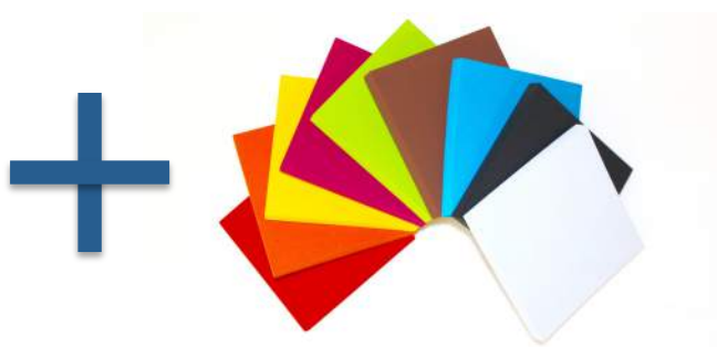
Panneau mousse Absorbruit® Remplaçables si besoin ou abimés